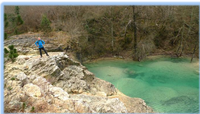
Nad slapom Zelenšček