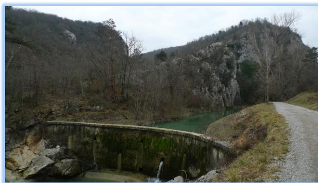
Ob izhodu iz kanjona reke Mirne